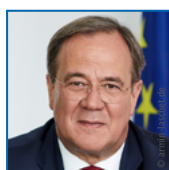
Armin Laschet CDU