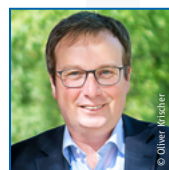
Oliver Krischer Bündnis 90/Die Grünen