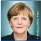
Dr. Angela Merkel Bundeskanzlerin der Bundesrepublik Deutschland