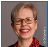
Eeva Karsta Drägerwerk