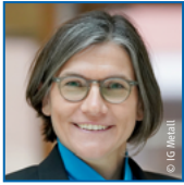
Christiane Benner IG Metall