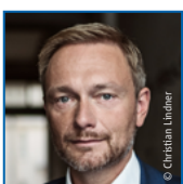
Christian Lindner FDP